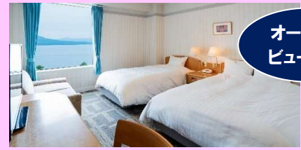
オーシャンビュー確約