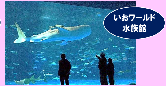
いおワールド水族館